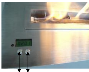
Ouverture réservoir 2 1 Switch on / off