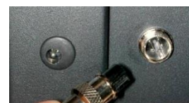
Contact sec de commande